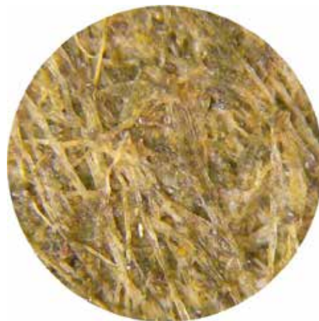
Microstructure of AFP 50X

FMC presenta su nuevo Papel de Fricción Avanzado (AFP), el cual otorga mayor vida útil en aplicaciones para camiones de minería con frenos húmedos. Las Fibras sintéticas que lo conforman, mejoran la resistencia térmica del material de fricción otorgándole mayor poder de frenado, como así también un mejor acoplamiento. AFP mejora más del doble la vida útil de un freno en comparación al Papel Standard, con tests que confirman un significativo ahorro de costos en Aplicaciones de Trabajo Pesado. El enlazamiento térmico también ayuda a fortalecer el material, lo que conlleva a mejores tasas de desgaste y a una mayor vida útil.